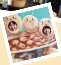
トレンドィハウス社員遠足！ ウェルワークとちぎ（とちのきツアー）山形「佐藤錦」さくらんぼ狩りと 贅沢三昧「米沢牛二種盛り御膳」に参加してきました♪ とってもあま〜いさくらんぼを、たくさん食べて大満足でした◎