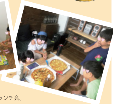
8月のとある一日。 スタッフの子供たちと一緒にランチ会。 トレンドィハウスでは、 「いい仕事いい家庭つぎつぎとちぎ宣言」にもとづいて スタッフの子育てを応援しています◎