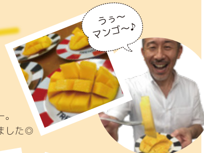
お客様より 届きましたマンゴー。 美味しくいただきました◎