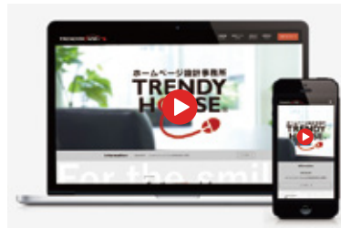
有限会社トレンディハウス コーポレートサイト www.trendyhouse.co.jp

見えるようなサイトづくりを心掛けました。お客さまが知りたい情報にきちんと辿り着けるよう、サイト導線にも気を配っています。