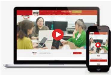
ホームページ設計事務所 トレンディハウス サービスサイト